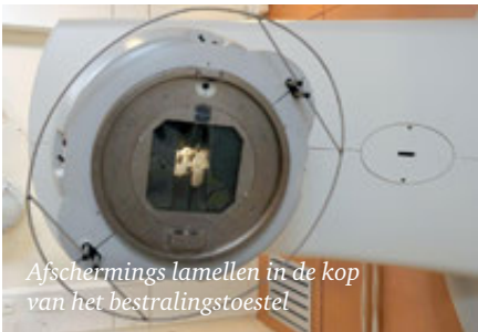
Afschermings lamellen in de kop van het bestralingstoestel

Radiotherapie betekent een behandeling met straling. Bij een uitwendige bestraling wordt gebruik gemaakt van een zeer krachtige röntgenstraling. Deze wordt opgewekt in het bestralingstoestel, de lineaire versneller. De straling dringt via de huid, diep in het lichaam door. De straling komt uit de kop van het bestralingstoestel. Hierin bevinden zich afschermingslamellen die in elke positie kunnen worden geschoven, zodanig dat het juiste bestralingsgebied gevormd wordt. Omgevende, gezonde weefsels worden op deze manier zoveel mogelijk afgeschermd.